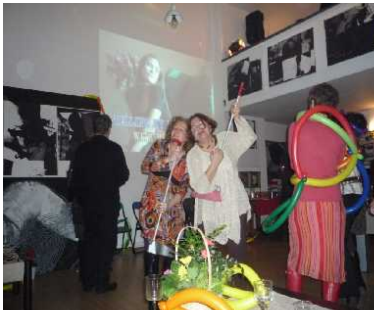
Happening artistic feminist privat cu MM cântând simbolic la...m tur